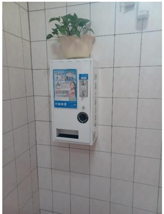
5樓大東女廁加裝衛生棉機