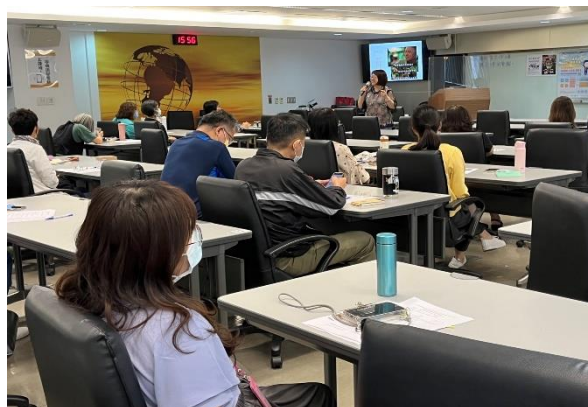
上課實景(多元形式:演講)