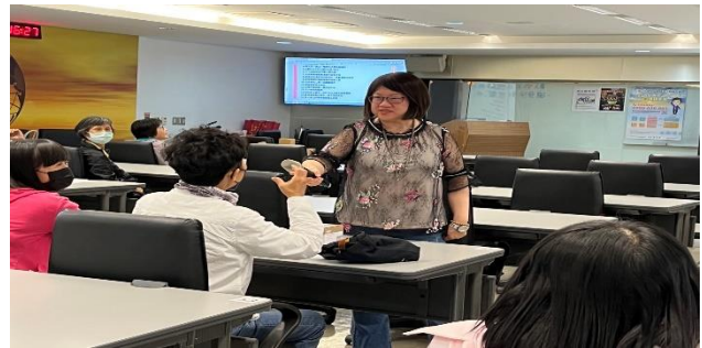
上課實景(多元形式：心得分享)