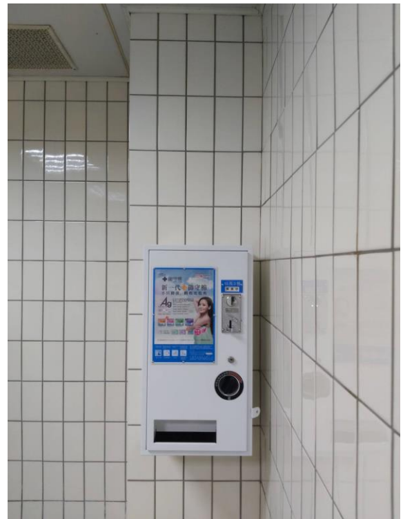
文心二辦 1 樓北側