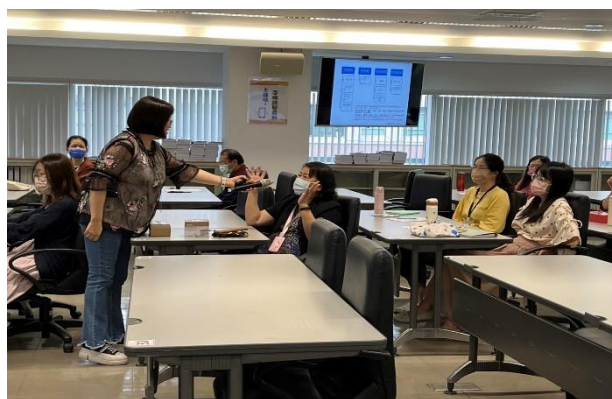
上課實景(多元形式:心得分享)