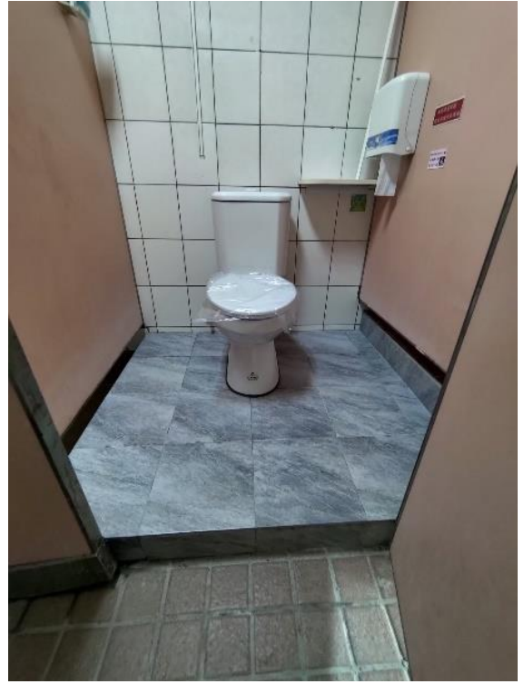
5樓小西女廁蹲式改坐式馬桶