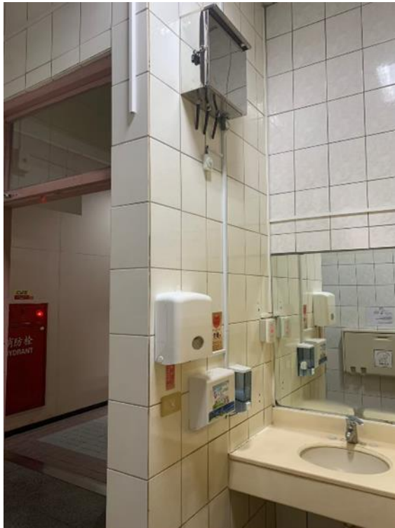
1樓親子廁所加裝智慧廁間管理