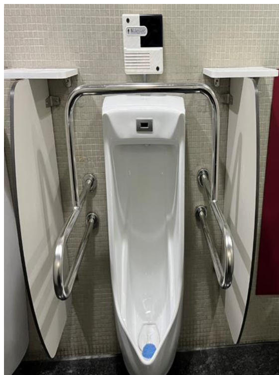
文心、惠中 1F 小便斗無障礙扶手