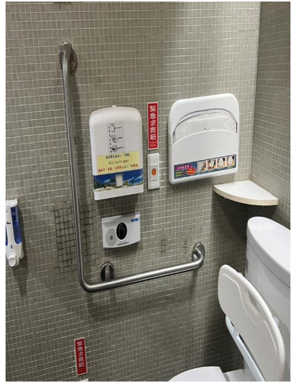
文心樓 1F 無障礙廁所-L型扶手