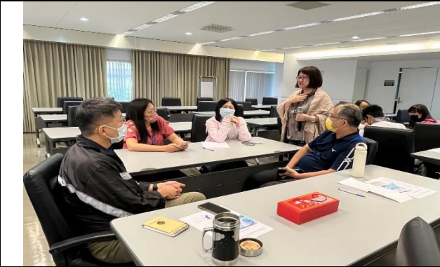
上課實景(多元形式：分組討論)