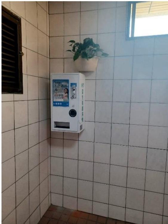
1樓大東女廁加裝衛生棉機