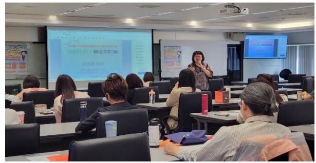
上課實景(多元形式：演講)