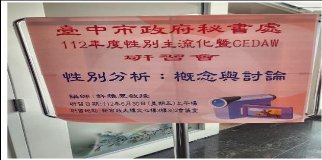
內容：課程海報或簡報首頁