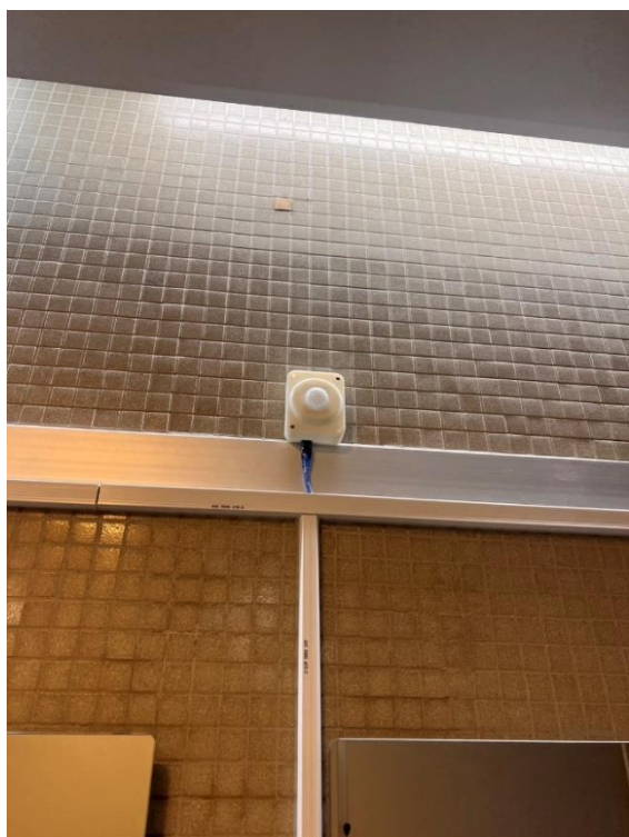
人流、溫度、濕度、臭味偵測