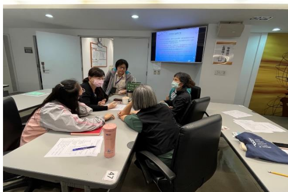
上課實景(多元形式:小組討論)