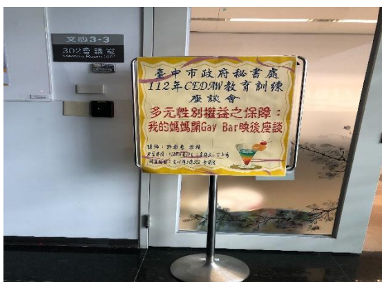
內容：課程海報或簡報首頁