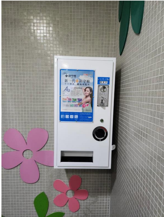
惠中川 1F 女廁