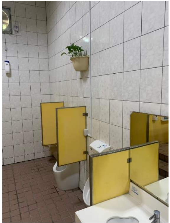
1樓親子廁所加裝智慧廁間管理