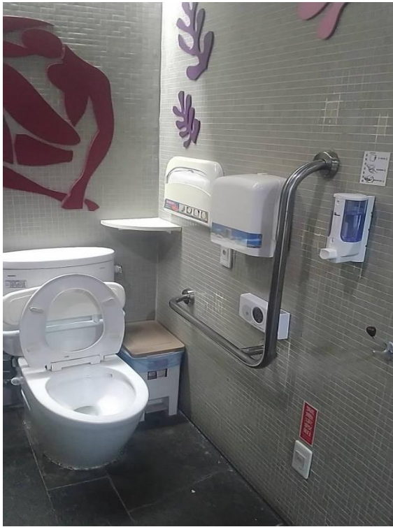
惠中樓 1F 無障礙廁所-L型扶手