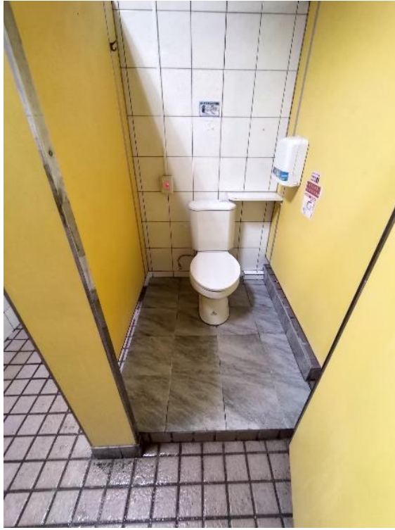
3樓小西男廁蹲式改坐式馬桶