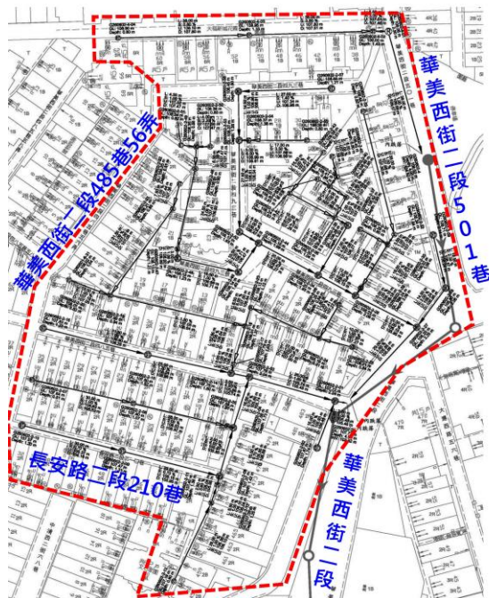
臺中市污水下水道公告使用區域之範圍圖 西屯區大福里附近地區