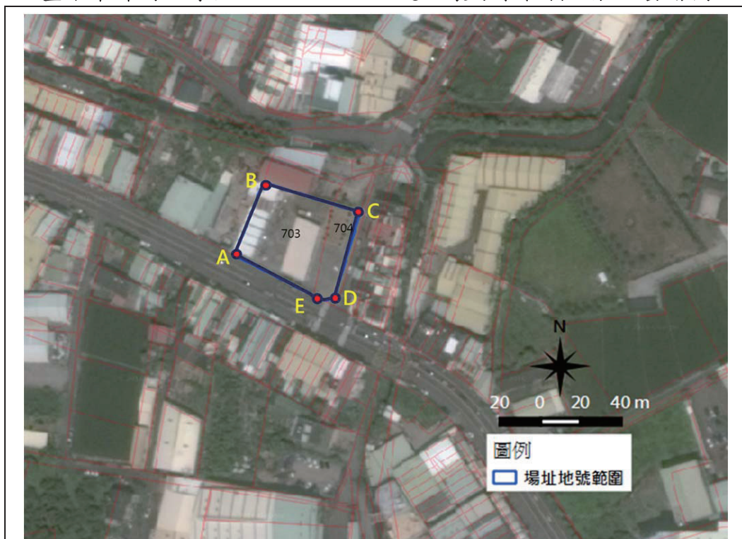
臺中市神岡區厚生段 703、704 地號土壤污染管制區航照套繪圖