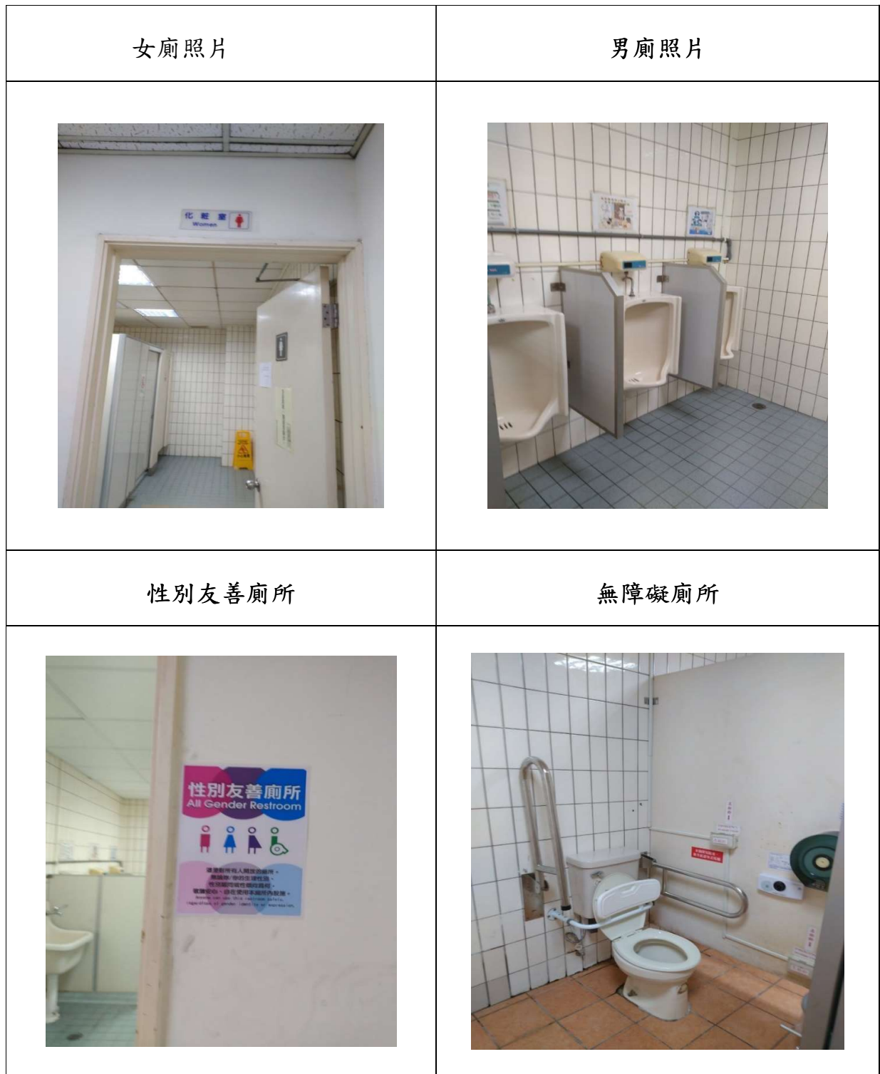
表 3、文心第二市政大樓廁所現況照片